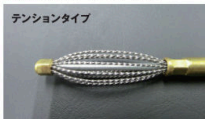
通し穴の側面や交差バリ取り