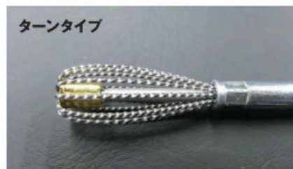
止まり穴の底面・側面のバリ取り