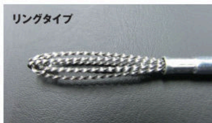
止まり穴の底面・側面のバリ取り