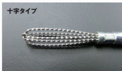
止まり穴の底面・側面のバリ取り