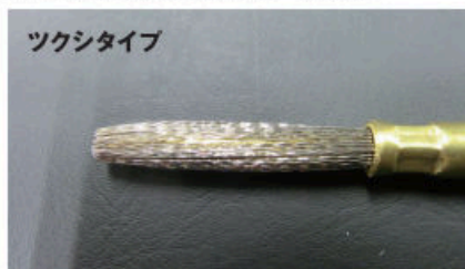
止まり穴の底面・側面のバリ取りやサビ取り