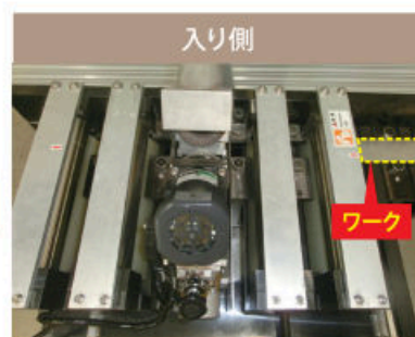
テストワークの流れが分かり易いように点線を付けています。