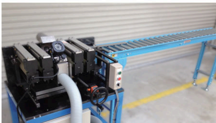
別売りにて長尺用コンベアがセットできます。