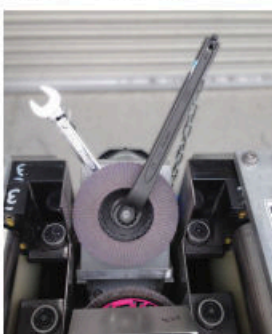
ディスクの交換は付属スパナで簡単に行えます。