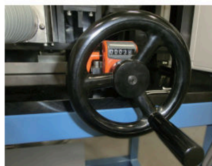
板幅調整はハンドルにて調整できます。