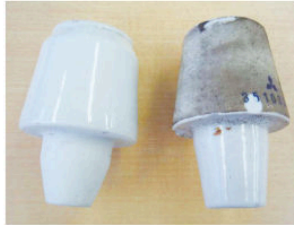
(右) 使用済みの汚れた磚子 (左) ブラッシング洗浄後の磚子