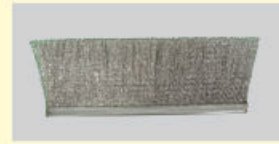
チャンネル直線ブラシ

チャンネル(CH)と呼ばれる、 \sqsubset 字型の金属にブラシ毛材を二つ折れにし、芯線で押さえ込み、チャンネル上部をすぼめて毛材を抜けないようにしてあります。